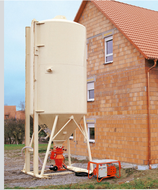
Transportorul pneumatic PFT SILOMAT trans plus